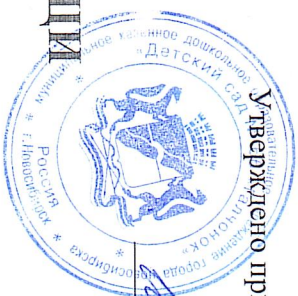
ГРАФИК ВЫДАЧИ И ПРИЕМА ПИЩИ с 30.12.2022 г.